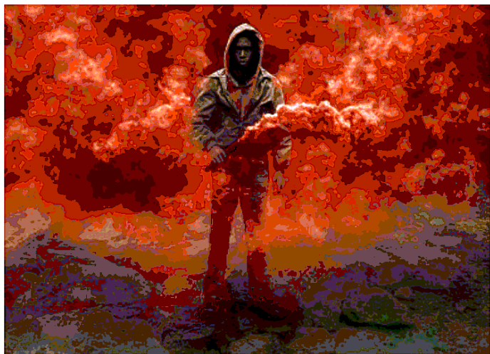
Una scena del film "Captive State" di Rupert Wyatt