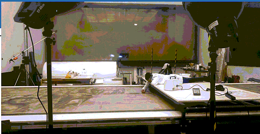
Un momento dell'intervento di pulizia e restauro del cartone di Raffaello all'Ambrosiana. Sotto, un dettaglio del disegno