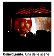
Coinvolgente. Una delle scene