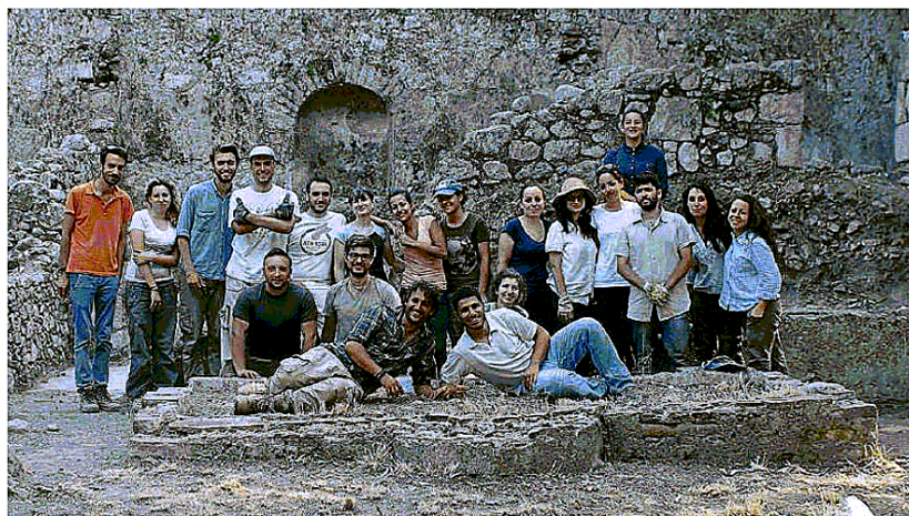
Al sito. Alcuni degli studiosi americani che hanno eseguito studi e rilievi all'interno della storica Villa San Pancrazio

Nel maggio 2016 venne stipulata una convenzione tra l'Università di Messina, la Soprintendenza di Messina e la "Luxury Collection Srl" e da allora è scattata una nuova stagione di ricerca sul sito, proseguita con l'apertura di uno scavo condotto dall'Università di Messina in collaborazione con la Soprintendenza e la partecipazione del Cnr-Ibam di Catania e di "Archeotouch Srl", spin-off costituito da giovani archeologi dell'Ateneo messinese. Un dispendio di risorse umane ed economiche interamente finanziato dalla nuova proprietà con archeologi, restauratori, operai e mezzi meccanici. I lavori sono proseguiti sino a fine luglio 2017 con l'impegno di circa 40 studenti. È stato individuato un ricco quartiere residenziale di età romana cui si sovrappongono strutture più tarde, di epoca bizantina e medievale. A sud della Domus già nota, è emersa una seconda abitazione con un cortile porticato e alcuni vani con decorazioni parietali dipinte e mosaici di grande pregio. Le due case sono separate da una strada molto ben conservata, pavimentata con lastre in pietra e contenuta da un possente muro di terrazzamento. Adesso l'area delle Domus è destinato a diventare, in prospettiva, un ulteriore sito museale, di eccezionale pregio, per Taormina. <